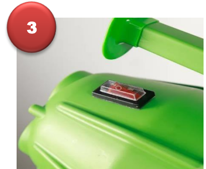
3.- Encienda el interruptor