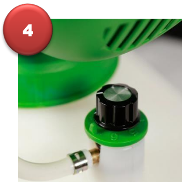
4.- Ajuste el interruptor de flujo