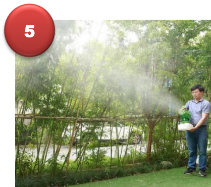
5.- Realice la operación de pulverización