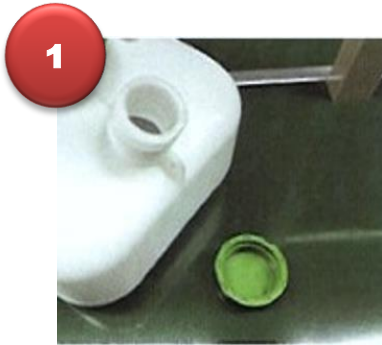
1.- Agrega el insumo (poción)