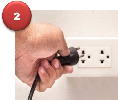
2.- Conecte a la fuente de alimentación